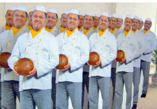
Rund 500 lebensgroße Werbeaufsteller verlassen jährlich das Unternehmen.